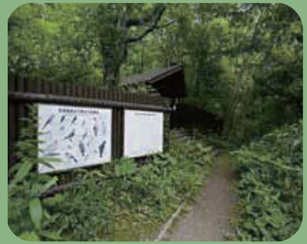
〈野鳥の森にて森林浴〉